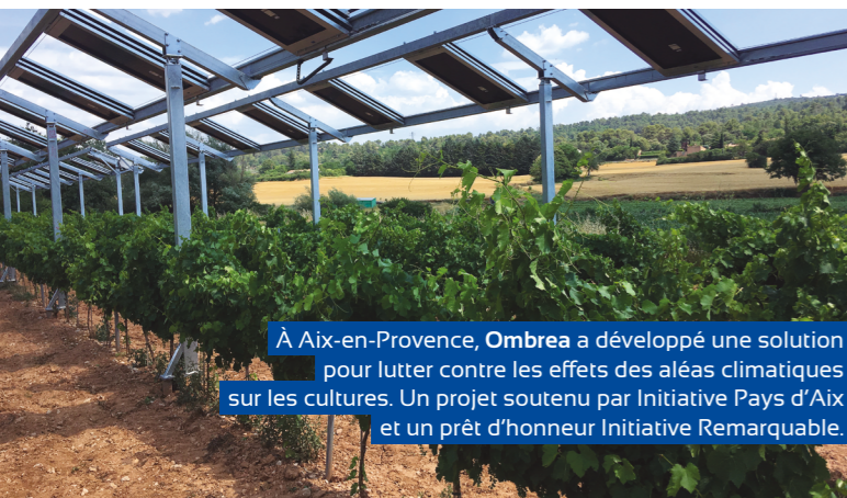
À Aix-en-Provence, Ombrea a développé une solution pour lutter contre les effets des aléas climatiques sur les cultures. Un projet soutenu par Initiative Pays d'Aix et un prêt d'honneur Initiative Remarquable.