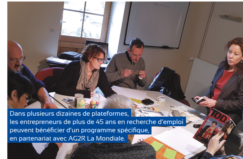
Dans plusieurs dizaines de plateformes, les entrepreneurs de plus de 45 ans en recherche d'emploi peuvent bénéficier d'un programme spécifique, en partenariat avec AG2R La Mondiale.

Depuis 2017, Initiative France et son partenaire AG2R La Mondiale ont accueilli plus de 700 porteurs de projets, dont 54 % de femmes et 84 % de demandeurs d'emploi, au sein du programme 45 +, un parcours d'accompagnement renforcé qui s'adapte à la situation personnelle de chaque porteur de projet pour renforcer ses chances de réussite. Au terme de ces trois ans, plus de 200 entreprises ont été créées et leur pérennité est bien supérieure à la moyenne nationale.