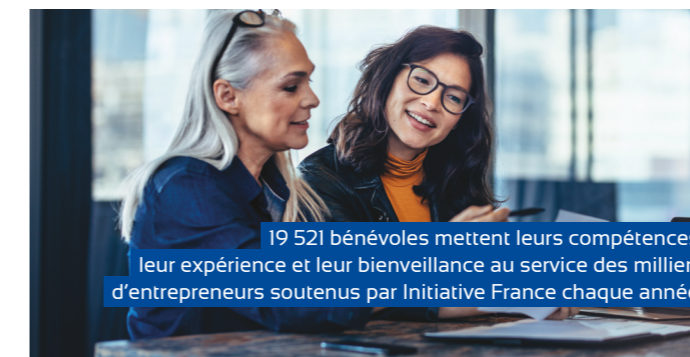
19 521 bénévoles mettent leurs compétences, leur expérience et leur bienveillance au service des milliers d'entrepreneurs soutenus par Initiative France chaque année.

Le parrainage est un axe fort de la Promesse Initiative France. En 2019, 8 000 entrepreneurs étaient parrainés par les 4 500 marraines et parrains du réseau. Une campagne nationale de recrutement, à l'occasion de la dernière Fête des marraines et parrains, en novembre 2019, a convaincu de nouveaux chefs d'entreprise de tous secteurs de mettre leurs compétences et leur expérience au service de la réussite des nouveaux entrepreneurs.